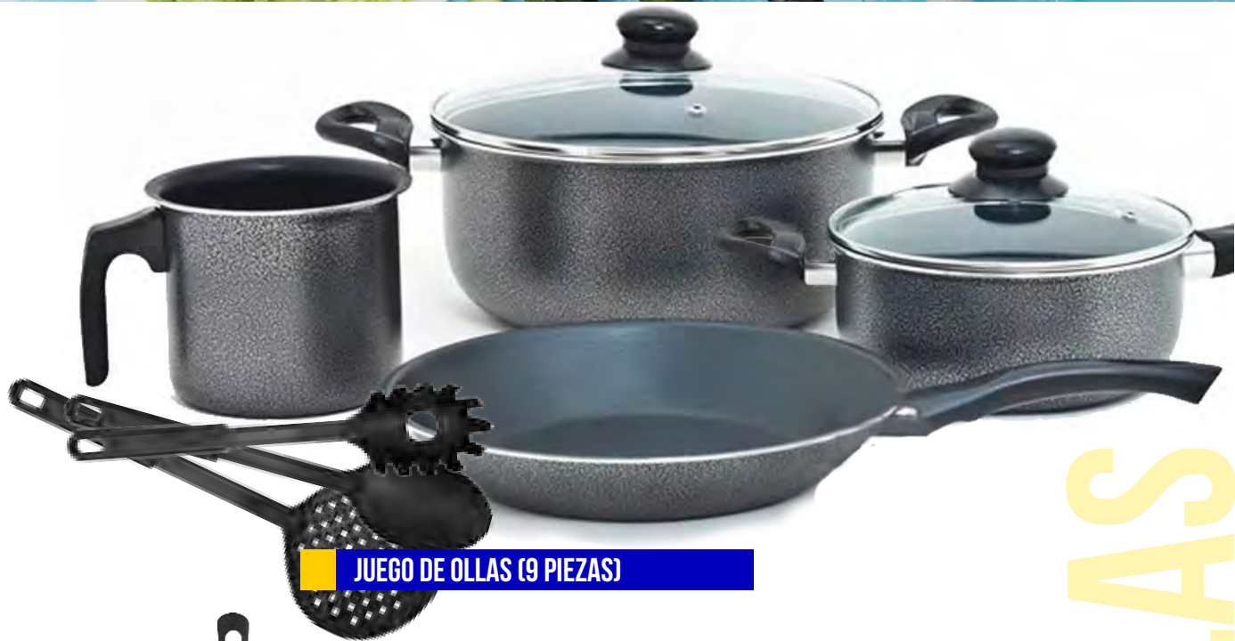
JUEGO DE OLLAS (9 PIEZAS)