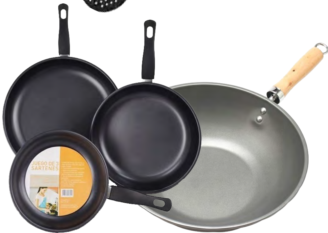
SET SARTENES + WOK